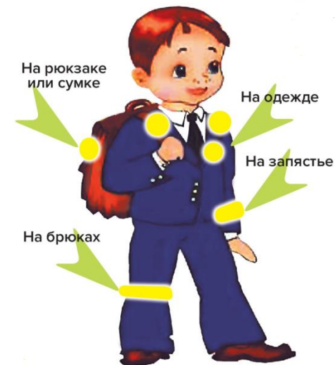
На рюкзаке или сумке